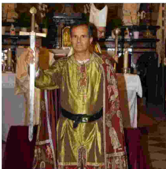
Il corteo in centro e (sopra) la successiva cerimonia nella chiesa di Sant'Ambrogio. Qui a lato: La Rocca