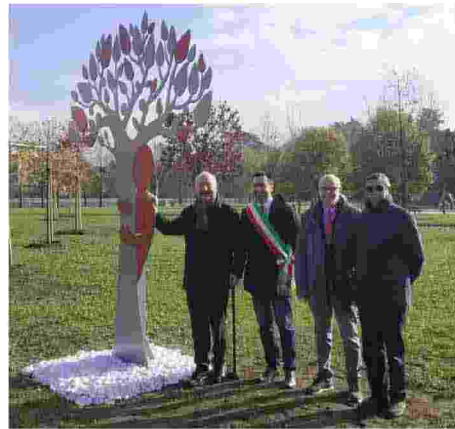
L'inaugurazione del Bosco vivo nel novembre scorso